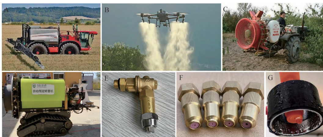
A: 自走式喷雾机(张校康,2021);B:T60植保无人机;C:自动对靶静电喷雾机(余忠义等,2025);D:果园自主导航兼自动对靶喷雾机器人(刘理民等,2022);E:扇形雾喷头;F:锥形雾喷头;G:静电辅助喷头(马旭等,2020)。A: Self-propelled sprayer (Zhang, 2021); B: T60 plant protection UAV; C: automatic target-oriented electrostatic sprayer (Yu et al., 2025); D: autonomous navigation and target-oriented spraying robot for orchards (Liu et al., 2022); E: fan spray nozzle; F: conical spray nozzle; G: electrostatic-assisted spray nozzle (Ma et al., 2020).